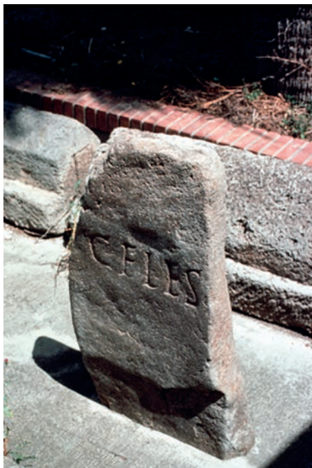
Fig. 3: Fonni, CELES, CIL X 7889 (Collezione Attilio Mastino)

Nella Geografia di Tolomeo ( Geogr. 3, 3, 1–8) si ricordano otto popoli legati a poleis e undici insediati ( katécbontes ) da Nord a Sud in Sardegna. Escludiamo in questa sede i Kórsioi , e i popoli costieri come i Roubrensioi da avvicinare ai Rubr(enses) di Custodia Rubriensis-Barisardo (apparentemente un sito fortificato, Custodia presso le rocce rosse di Arbatax): un cippo terminale ricorda i Rubr(enses) proprio a Barisardo al confine con gli Altic(ienses) (ILSard I 184); i Karénsioi , da collegare a Fanum Carisi (oggi Irgoli), vanno confrontati coi Cares(ii) del diploma del soldato della II coorte Gemina di Liguri e Corsi rinvenuto a Dorgali (CIL XVI 40) e gli immigrati dalla Sicilia, i Sikoulénsioi o dall'Etruria gli Aisaronénsioi .