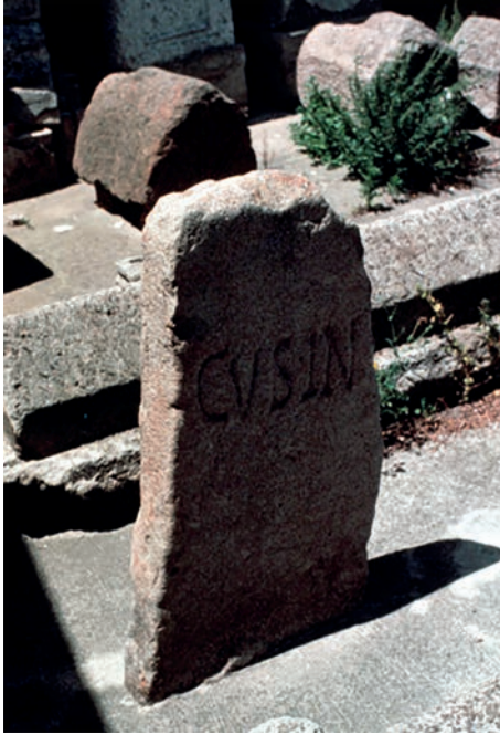
Fig. 2: Fonnus, CVSIN, CIL X 7889

ad Austis agli inizi del I secolo d.C. Ad Austis, come desumiamo dal toponimo odierno, che continua il medievale Agustis e il latino *Augustis 108 , presumibilmente nel sito della distrutta chiesa di Sant'Agostino, fu costituito l'insediamento denominato Augustis in locativo ovvero Augusti . In Africa e più precisamente a Milev, nella Numidia cirtense (Algeria), conosciamo un ausiliario al comando di dieci soldati arrivato dalla Sardegna, forse da Austis nel I secolo d.C., Optatus Sadicis f(i)lius decurio co(ho)rti(s) Lusitana(e) , sicuramente un Sardus 109 ; il reparto di Lusitani sarebbe stato trasferito da Austis a Milev in occasione della rivolta di Tacfarinas 110 .