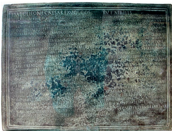
Fig. 4: La Tavola di Esterzili, CIL X 7852

potrebbe in ipotesi riferirsi da un lato alla gens di appartenenza [non natio ] del veterano Hannibal Nur(ritanus) oppure Nur(rensis) , dall'altro lato, il secondo Alb(---) potrebbe indicare “la civitas , da intendersi come un gruppo più limitato all'interno della prima”: del resto è vero che nei diplomi militari la menzione del luogo d'origine è di solito preceduta dalla provincia e seguita dal vicus o dal pagus per i soldati provenienti da aree rurali: viceversa è più abituale il riferimento all'etnico di afferenza (nel nostro caso allora Nurritanus ), seguito dal pagus 124 : la questione resta indubbiamente misteriosa.