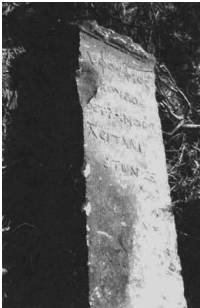
FIG. 13 - Uadi bu Nabeħ (Gebel el-Akhdar). Stele di Λ(ούκιος) Φούφιος [Σέ]κονδος, veterano della legione I Italica (IRCyr2020, M.215).

Al XVIII convegno tenutosi a Olbia nel 2008 Joyce Reynolds compare solo nell'elenco dei partecipanti 69 . Ancora tornò in Sardegna nel dicembre 2010 al