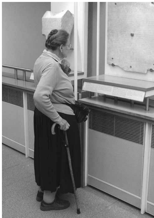
FIG. 9 - Joyce Reynolds in visita a Roma alla sezione epigrafica del Museo Nazionale Romano - Terme di Diocleziano, 2006.

La scelta di Joyce Reynolds di aderire al comitato scientifico de L'Africa Romana e di partecipare ai nostri incontri annuali finì per essere davvero 'drastica', perché comportava, oltre che l'inclusione della