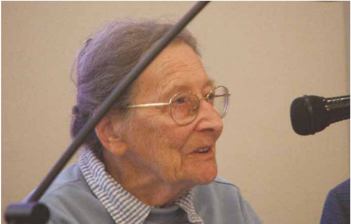
FIG. 10 - Joyce Reynolds interviena alla XIV e Rencontre sur l'épigraphie in onore di Silvio Panciera tenutasi a Roma, ottobre 2006.

ca. Da allora i suoi amici libici sono diventati anche i nostri amici, le sue curiosità e le sue passioni ci hanno coinvolto.