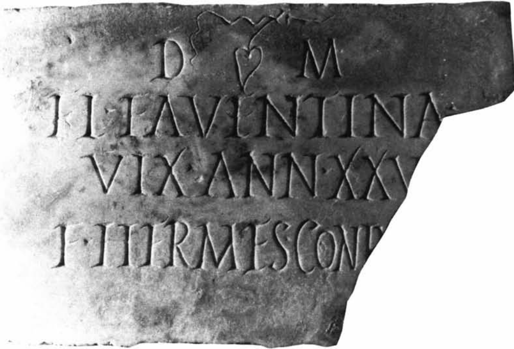
Fig. 3 - Iscrizione sepolcrale rinvenuta a Portotorres, in Vico Colonia romana (Antiquarium Turritano).

Il nome del marito dedicante è Hermes : è stata più volte segnalata la relativa abbondanza a Turrus Libisonis di cognomi grecanici, forse in rapporto con le caratteristiche della colonizzazione ed in particolare come conseguenza di un rilevante apporto etnico orientale (il 30% dei cognomi turritano sono grecanici, contro il 15% dell'intera Sardegna) (32) .