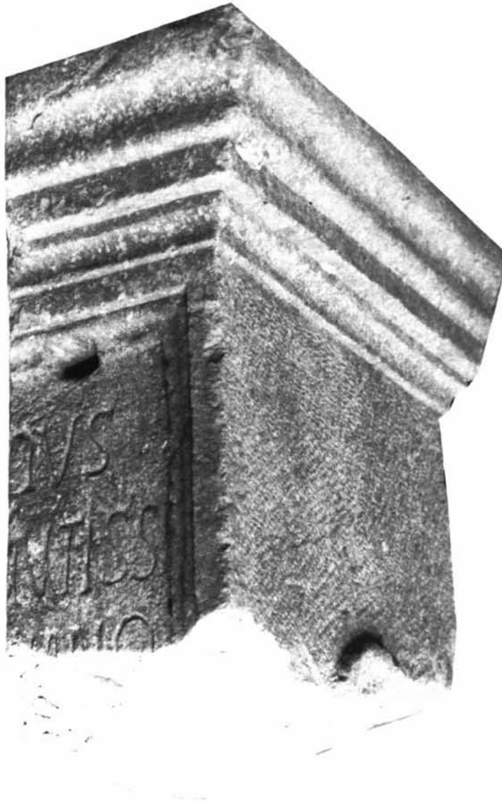
Fig. 4 - Ara funeraria con iscrizione da Turris Libisonis ( Museo Sanna, Sassari ).

pensarsi perciò ad un peregrino, coniugato con una Flavia non ingenua, ma liberta, anche se tale condizione non è espressamente ricordata, in quanto scontata. Il fatto poi che la donna porti un cognome latino e non greco, non può certo rappresentare una prova contraria (39) .