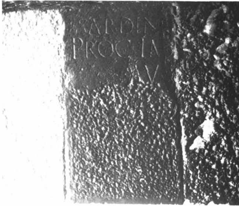
Fig. 2 - Iscrizione su un grande blocco di marmo inserito nella costruzione di un pilastro cruciforme nella Basilica di S. Gavino di Portotorres.

con la colonizzazione del I secolo, che confermano, assieme ai cognomi greci, all'elevato numero di liberti ed alla presenza di schiavi e liberti orientali, la modesta condizione di partenza e l'ascesa di intere famiglie nella scala sociale (26) .