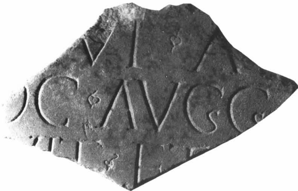
Fig. 1 - Epigrafe frammentaria dal Palazzo di Re Barbaro, Portotorres (Antiquarium Turritano).

166) (10) e soprattutto l'iniziale A[- - ] , che potrebbe essere quella del cognomen ex virtute Armeniacus , adottato da Lucio Vero alla fine del 163 (11) e da Marco Aurelio nel 164 (12) ed attestato sulle iscrizioni appunto fino al 166 (13) : il titolo è connesso al bellum Armeniacum et Parthicum di Lucio Vero (14) ed in particolare alla spedizione di Stazio Prisco contro l'Armenia, alla presa di Artaxata ed alla deposizione di Pacoro (15) .