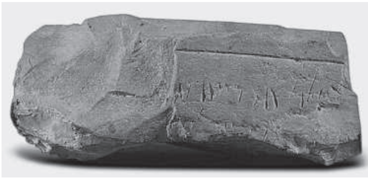
FIG. 9. La dedica effettuata da una seva di Venere Ericina a Capo Sant'Elia, Cagliari.