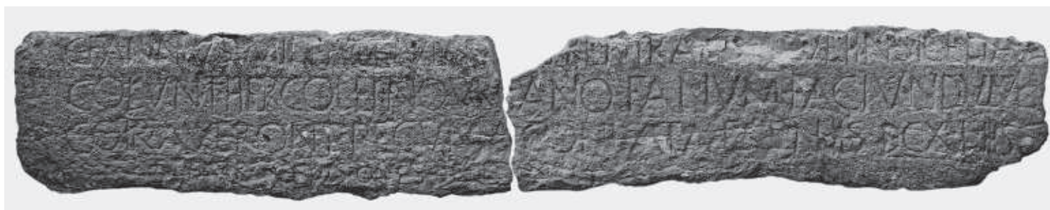
Fig. 7. L'iscrizione di Capo Boeo.