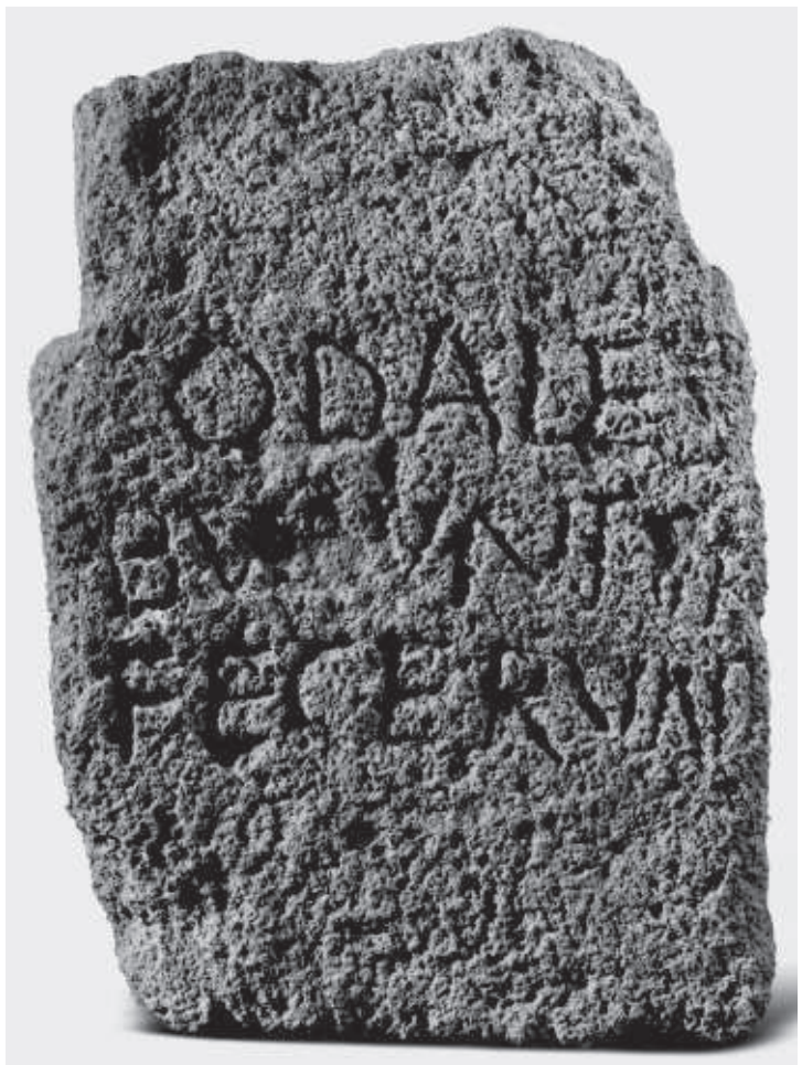
FIG. 4. Nurra, il cippo dei Sodales Buduntini apuli.

Infine nel mare ad occidente della Sardegna collochiamo Nure, l'isola di Minorca, Minor , nelle Baleari, 4 sulla rotta che sarebbe stata miticamente percorsa da Norace partito dall'Iberia 5 per raggiungere l'Ἑρμαίον ἄκρον, Capo Marrargiu con la sua spelunca bovis , la grotta