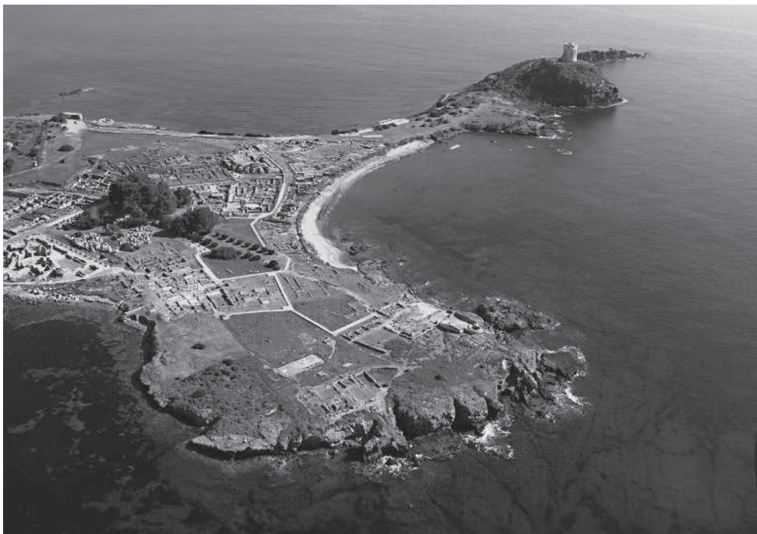
FIG. 1. Nora.

che ha investito in pieno i Frentani nelle loro sedi originarie, 1 per le caratteristiche arcaiche della lingua latina, per i collegamenti incrociati tra etnie differenti, partendo da Drepanum dove abitava un gruppo di Frentani oschi originari dell'Appennino adriatico apulo, in realtà ormai sradicati ed ora con lo sguardo che si spingeva oltre il Mare Africum , verso la Nora di Sardegna, come ci sembra testimoni l'epiclesi Nouritanus attribuita ad Ercole. 2 Sulla rotta tra Sicilia occidentale e Sardegna meridionale tra il 119 e il 116 a.C. aveva viaggiato il campano Lucilio, che sappiamo possedere latifondi in Sicilia e aver acquistato un muflone sardo. 3 Momenti particolarmente significativi per il nostro discorso sono i trionfi celebrati sui Sardi alla fine del II secolo a.C.: p. es. l'8 dicembre 122, il trionfo del proconsole Lucio Aurelio Oreste; il 15 luglio 111 il proconsole Marco Cecilio Metello, impegnato nell'area di Esterzili contro i Galillenses , forse promotore della colonizzazione extra-italica dei Patulcenses della Campania; attorno al 106 a.C. lo pseudo-trionfo nel campidoglio di Carales del propretore Tito Albucio sui mastrucati latrunculi , all'origine della colonizzazione dei Valentini . 4 Sui rapporti marittimi tra Sicilia e Sarde-