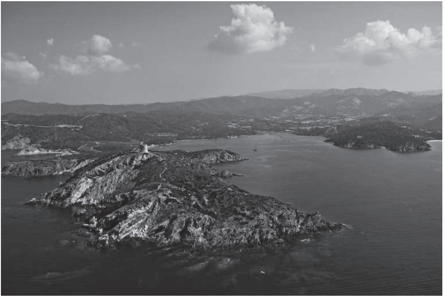
FIG. 2. Il Porto d'Ercole presso Nora, Capo Malfatano.