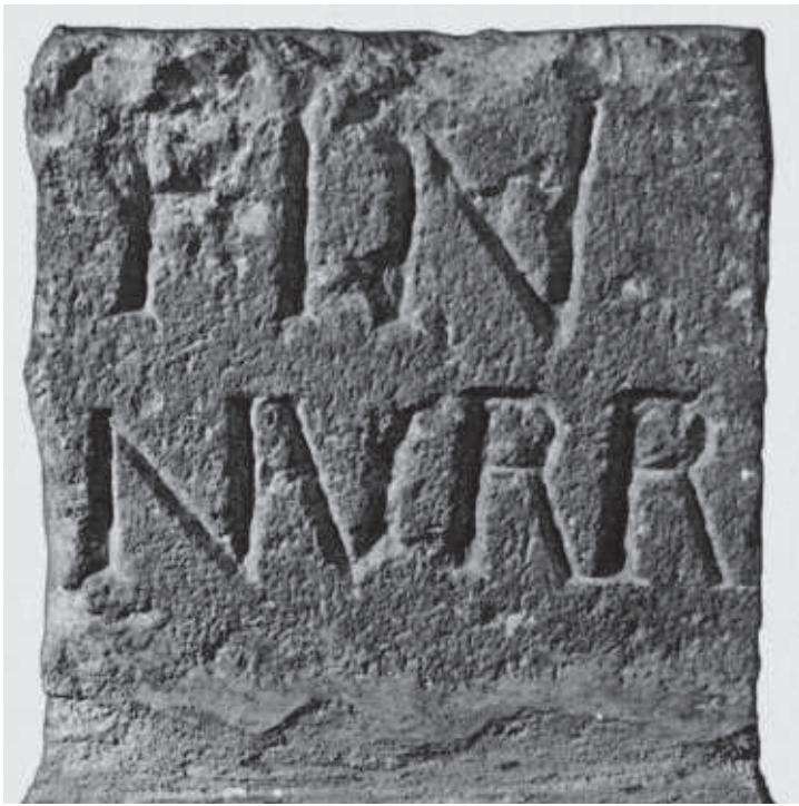
FIG. 5. Il cippo dei Nurr(itani) sul medio Tirso.

del bue marino, che ricorda la presenza di foche, 1 dove la terra finisce e il mare comincia verso l'estremo Occidente; è la stessa denominazione del Capo Bon in Nord Africa. 2