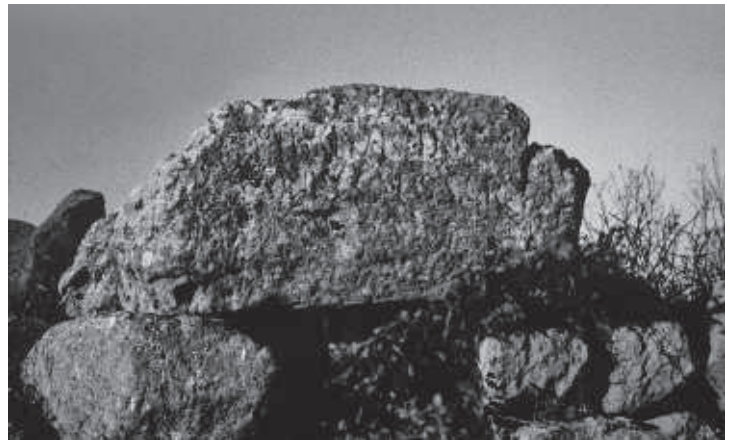
FIG. 6. Il nuraghe Aidu 'entos con il terminus degli Ilii (Mulargia).

della cittadinanza romana ( ceives ) assieme a C(aius) Fannius Min(i) f(ilius) , che fecero costruire un tempio extraurbano ad Hercolei Nouritano sul mare che vedeva a 190 miglia il promonturium Caralitanum in Sardegna; 4 distanza analoga a quella che l'Itinerario Marittimo calcolava tra Cagliari e Cartagine, 1500 stadi, 187 miglia. 5