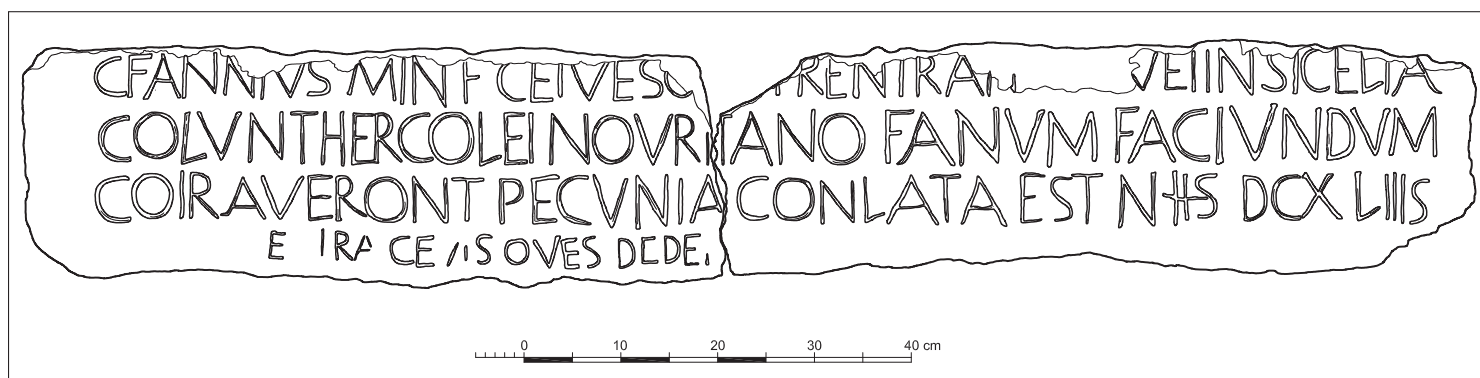
Fig. 8. Riproduzione grafica dell'iscrizione di Lilibeo (Elaborazione di Salvatore Ganga).

La l. 4 contiene certamente notizia di un sacrificio rituale di inauguratio di oves o [b]oves .