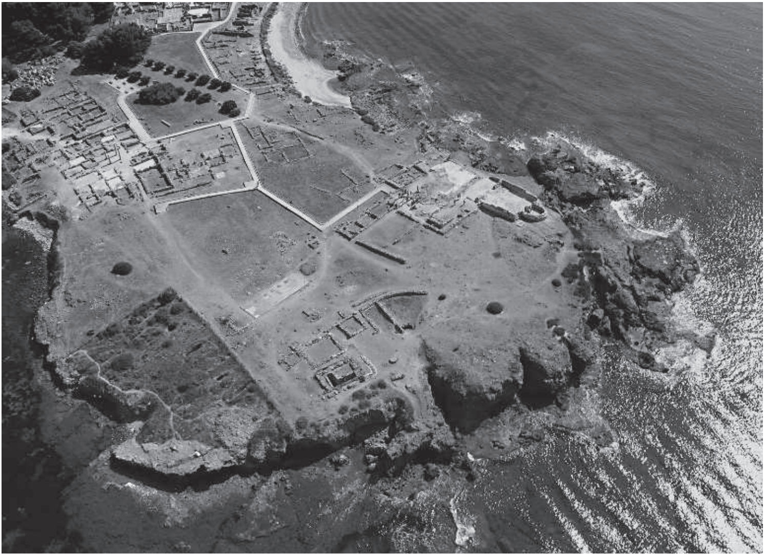
FIG. 3. Il tempio di Esculapio a Nora (Piero Bartoloni).

djerda), capitale della nuova provincia d'Africa dopo la distruzione di Cartagine; qui dovè sbarcare il tribuno Gaio Gracco, questore in Sardegna pochi anni prima, quando sfidando i tabù rituali, rifondò la colonia Iunonia nel sito della metropoli distrutta, accompagnato da 6000 famiglie di Italici. 1