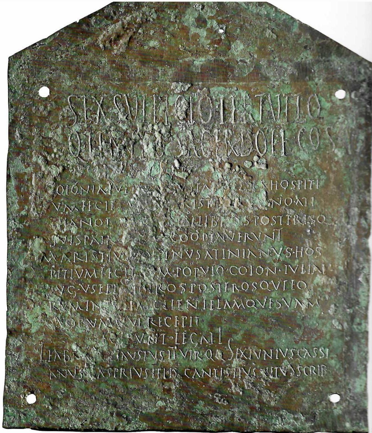
2. Tavola di Usellis , 158 d.C., bronzo, h 42 cm, proveniente da Usellus, Oristano, Aquarium Arborense . Si tratta di una rarissima tabula hospitalis et agrorum ; i fori ai lati fanno supporre che venisse appesa a un luogo pubblico.

Nerone: l'occupazione da parte dei Romani avvenne solo a partire dal 238 a.C., dopo la rivolta dei mercenari cartaginesi nel Nord Africa (all'indomani della conclusione della prima guerra romano-cartaginese), a opera del console Tiberio Sempronio Gracco, che poté procedere all'occupazione delle principali piazzeforti cartaginesi in Sardegna quasi senza combattere. Dopo la conquista, l'insieme del territorio della provincia fu dichiarato, sia pur teoricamente, "agro pubblico del Popolo Romano"; sulle terre