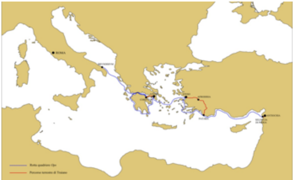
Fig. 2 - Ricostruzione del probabile percorso tenuto da Traiano nel viaggio verso Oriente del 113/114 (elaborazione grafica S. Ganga)