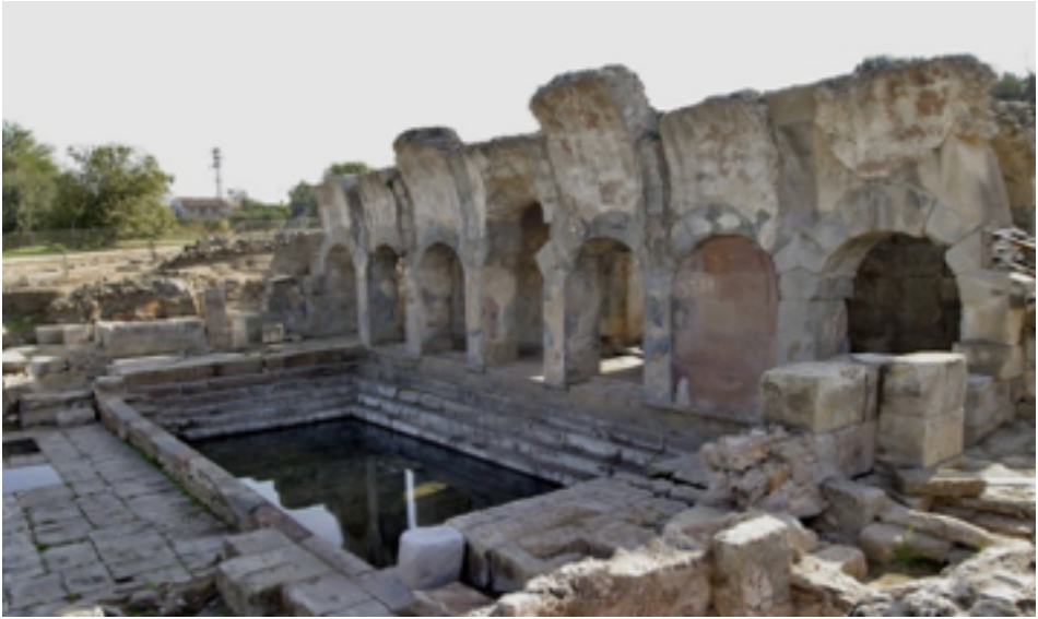
Fig. 1 - Forum Traiani /Fordongianus, Terme