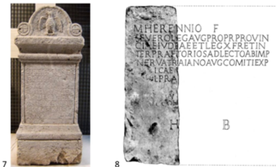
Fig. 7-8 - Cagliari (Museo Archeologico Nazionale). Epitafio di L. Tettius Crescens