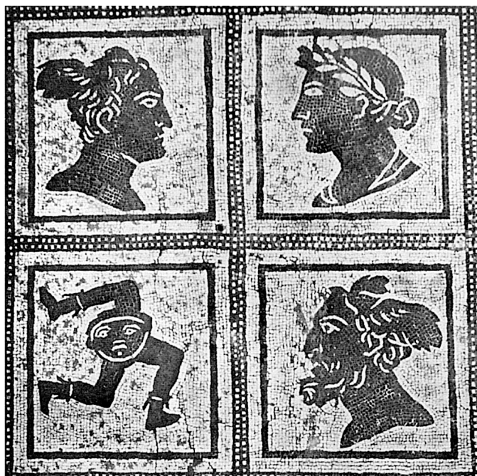
Fig. 3: La rappresentazione della Sicilia come triskeles

“perché quest’isola ha una felice posizione naturale per le spedizioni in tutta la terra abitata” 1 , non sembra che interessasse le isole del terzo bacino del Mediterraneo, benché gli eponimi di Sardegna e Corsica, Sárdos e Kúrnos , siano entrambi figli di Eracle 2 .