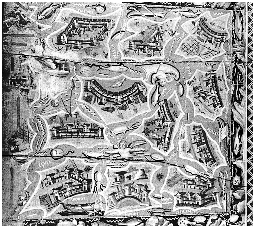
Fig. 2. Il mosaico delle insulae di Haidra

piuttosto che l'adattamento di Eryx , il figlio di Afrodite e Bytos , eponimo della città elimo-punica-romana di Eryx , al genitivo Erykos .