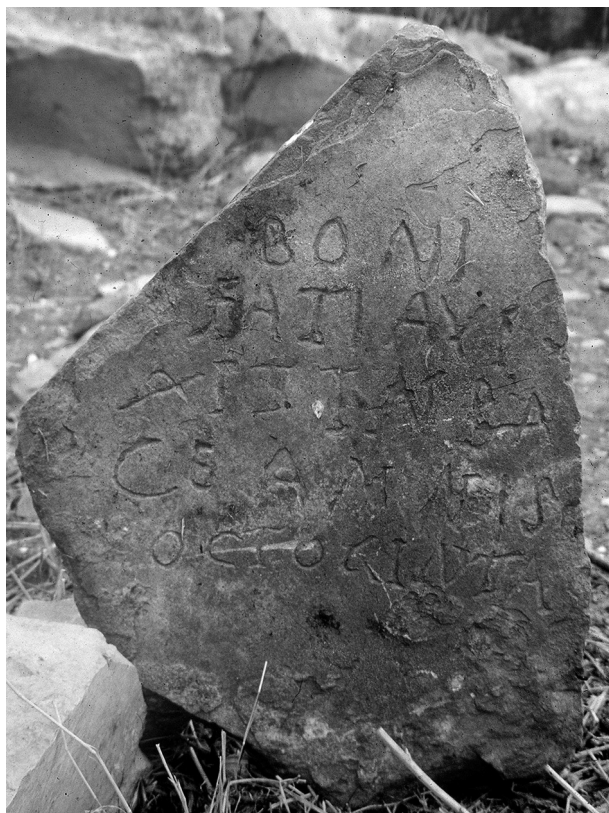
Fig. 3: Uchi Maius . L'epitafio della cristiana Bonifatia.

fossa delimitata da lastre rettangolari poste in verticale e ricoperta da uno strato di terra, aveva un'età tra i quindici e i venti anni 12 .