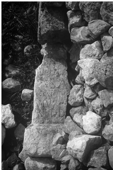
Fig. 7: Pagus Suttuensis , dedica a Mercurius.

Aug(usto) sacr(um) 20 posta presso la sorgente di alimentazione dell'acquedotto.