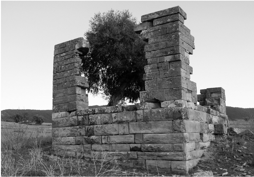
Fig. 8: Uchi Minus , il templum Cereris.