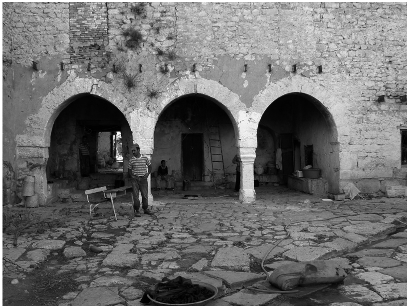
Figg. 4-5: Pagus Suttuensis , esterno e cortile.