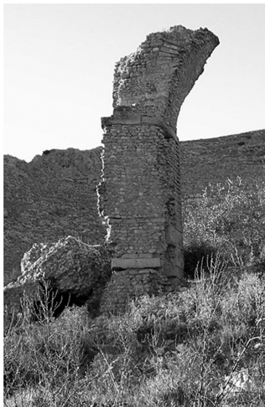
Fig. 6: Pagus Suttuensis , pilastro di un edificio connesso all'acquedotto.