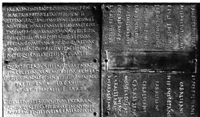
Fig. 3 – Il diploma di Anela (CIL X 7891 e XVI 9).

due mesi avrebbe inviato al Mommsen ed al Tobler ulteriori poesie sempre provenienti dalle Carte d'Arborea.