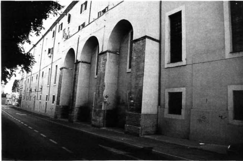
Fig. 9 – Sassari, il Palazzo dell'Università (visitato dal Mommsen il 23 ed il 26 ottobre 1877).

all'Archivio Arcivescovile, dato che non fu il Mommsen a trascrivere l'iscrizione turrìtana del tabularius delle pertiche di Turris e Tharros incisa su sarcofago rinvenuto