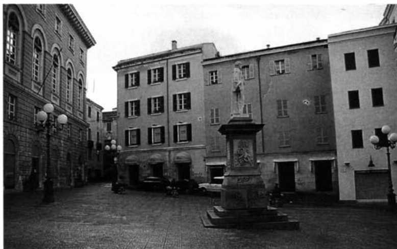
Fig. 7 – Sassari, Hotel Italia (il Mommsen vi si trattenne dal 23 al 27 ottobre 1877).

e più tardi sarebbe nato il Regio Museo di antichità, istituito da Umberto I con Regio decreto del 26 maggio 1878 (163) , finanziato con i fondi della Provincia e del Comune per l'Università ed inaugurato da Ettore Pais il 20 novembre 1880 nel contiguo palazzo di via Porta Nuova (Fig. 10) (164) . Certamente non vi fu invece una visita