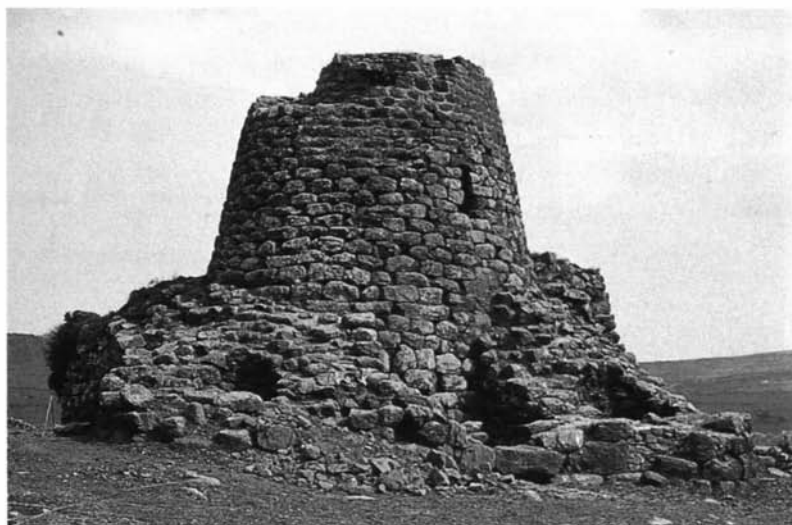
Fig. 6 – Macomer, Nuraghe Santa Barbara (visitato dal Mommsen il 23 ottobre 1877).