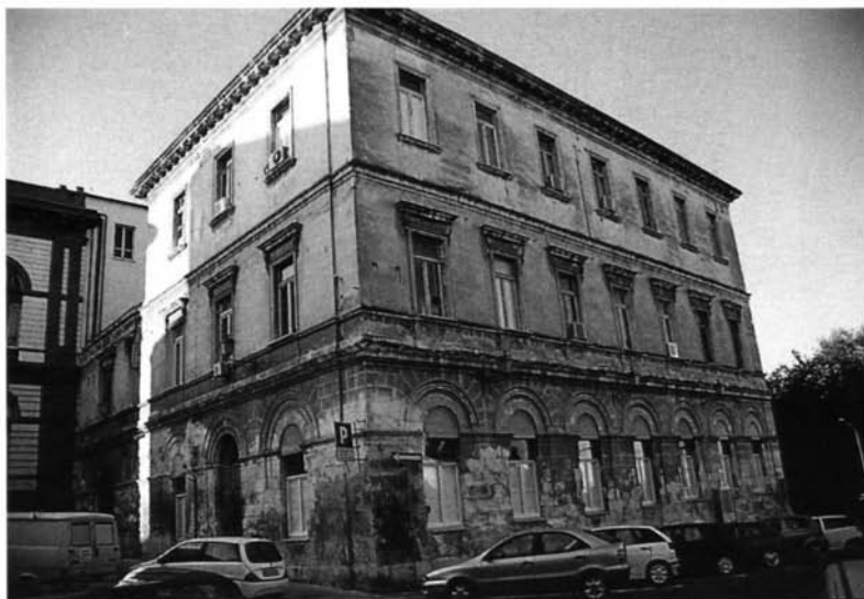
Fig. 10 – Sassari, il Palazzo di Via Porta Nuova, sede del Museo dell'Università dal 1880.

nel 1698 e ricordata apparentemente in una scheda di un Anonimus Hispanus (165) .