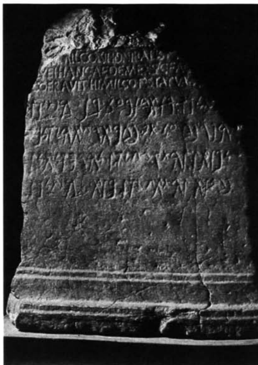
Fig. 12 – La bilingue scoperta a Sant’Antioco dallo Schmidt nell’aprile 1881 ( CIL X 7513 = CIS I 149 = ICO , Sard. Neop. 5).

materiale. Egli aveva schedato le iscrizioni sarde edite ed aveva proceduto ad una trascrizione di numerosi inediti di Cagliari, Nora e luoghi vicini. Gli appunti del Crespi diventavano ancora più utili, se non altro per verificare le informazioni fornite dal Nissardi, il quale di tanto in tanto diceva di essere stato in posti dove in realtà non era stato.