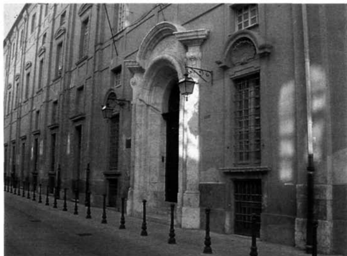
Fig. 4 – Cagliari, Palazzo dell'Università.

troverete il calco in quel Museo» (128) . E ancora: «Se qualche cosa possa occorrervi stando in Sicilia o in Sardegna, che io sia buono a procurarvi, scrivetemi subito».