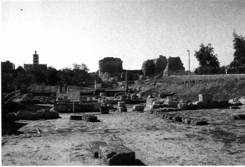
Fig. 8 – Portotorres, le Terme romane del Palazzo di re Barbaro (visitate dal Mommsen il 25 ottobre 1877).