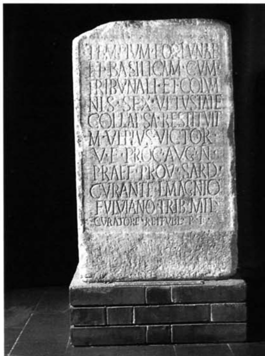
Fig. 2 – La base che ricorda a Turrus Libisonis il restauro del tempio della Fortuna (CIL X 7946).