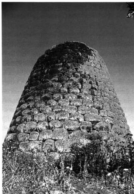
Fig. 11 – Codrongianus, Nuraghe Nieddu (visitato dal Mommsen il 26 ottobre 1877).

questa opinione con modesta titubanza, che non possano servire od essere servite per abitazioni o per templi, e per la scarsezza del numero e la incomodità nella prima ipotesi, o per la troppa abbondanza nella seconda. Ma egli stesso più volte si dichiarò con rara modestia incompetente a giudicarne, come anche asserì per quel che riguarda il palazzo del Re Barbaro , ossia tempio della Fortuna, che l'Ispettore degli scavi [lo stesso Amedeo] gli mostrò apparire meglio quale terma .