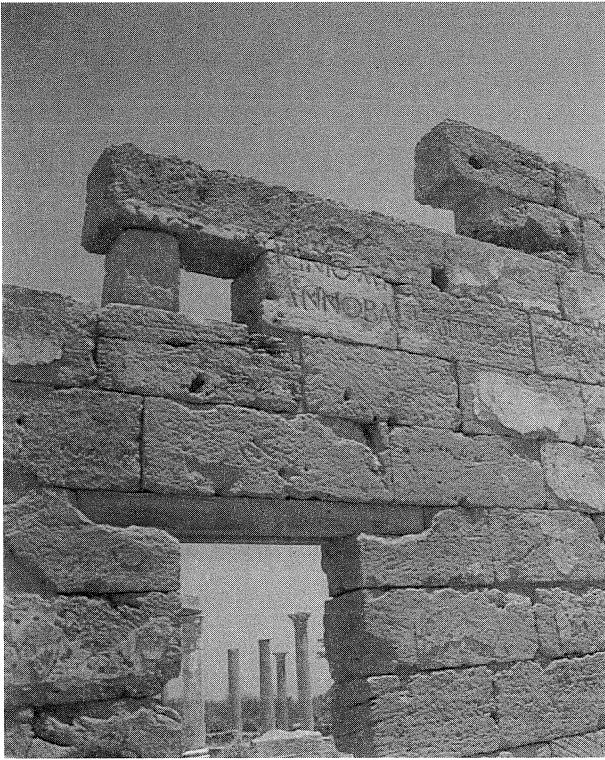
Fig. 1: Leptis Magna , muro di cinta: iscrizione monumentale incisa nell'8 a.C. durante l'età di Augusto, con dedica al proconsole Marcus Licinius Crassus Frugi ( IRTrip. , 319).

compare con il figlio Caracalla, propagator imperii , Geta, Giulia Domna, Plautilla, Plauziano. Non si dimenticano Paccia Marciana 66 , Septimia Octavilla 67 , Septimia Polla 68 , P. Septimius Geta fratello di Settimio Severo 69 . Ma conosciamo inoltre tutta una serie di ascendenti, come il padre di Settimio Severo P. Septimius Geta 70 , la madre Fulvia Pia 71 ed il nonno L. Septimius Severus , che un'iscrizione ricorda come praefectus