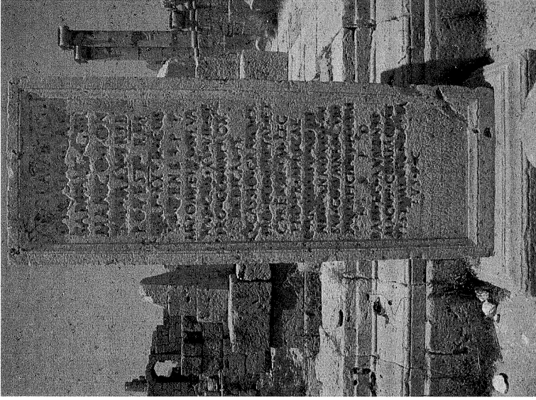
Fig. 3: Lepcis Magna, Forum Vetus , la dedica a Claudio effettuata nel 53 d.C. in occasione della costruzione del foro, dal proconsole Marcus Pompeius Silvanus e dal legato Quintus Cassius Gratus ( IRTrip. , 338).