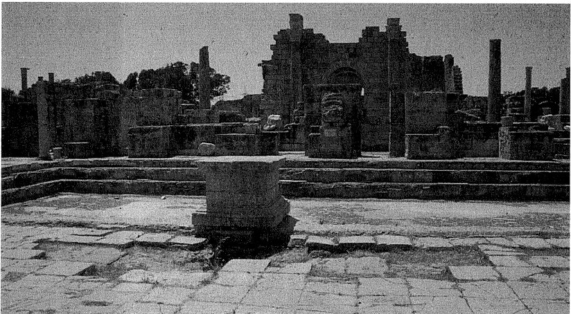
Fig. 7: Lepcis Magna , la natatio delle terme di Adriano.