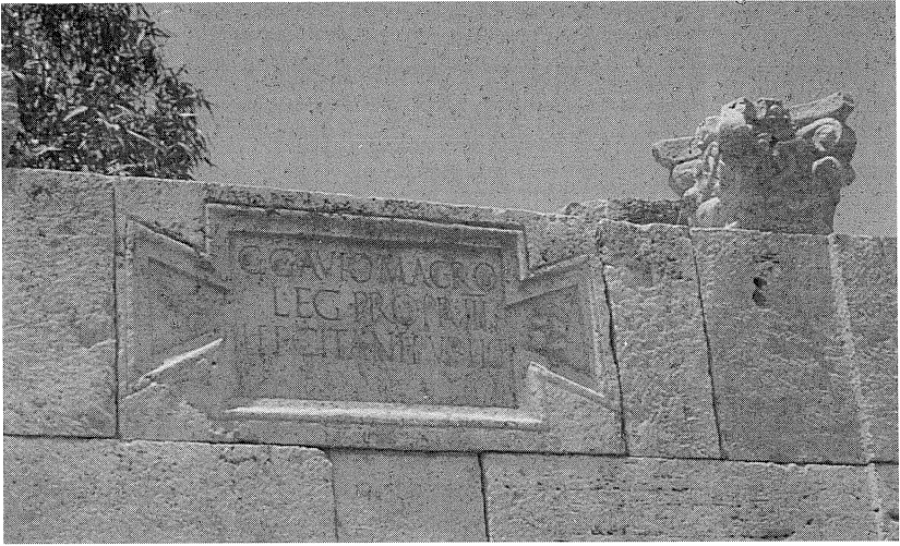
Fig. 4: Lepcis Magna , dedica dei Lepcitani a Gaius Gavius Macer , legato del proconsole Marcus Pompeius Silvanus nell'età di Claudio ( IRTrip. , 531).