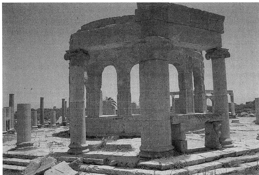
Fig. 9: Leptis Magna , il macellum.