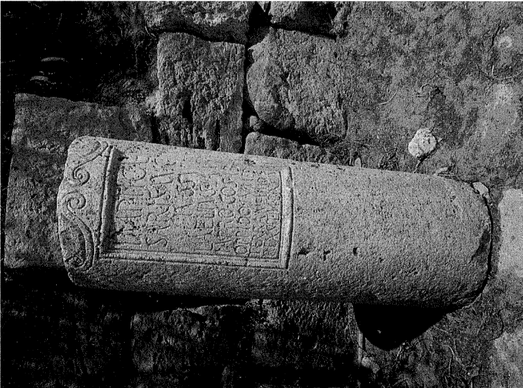
Fig. 2: Lepcis Magna , miliario di Tiberio posto tra il 14 ed il 17 d.C. dal proconsole Lucius Aelius Lamia ( IRTrip. , 930).