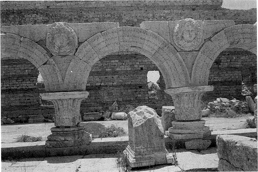
Fig. 5: Lepcis Magna , colonnato del foro severiano.