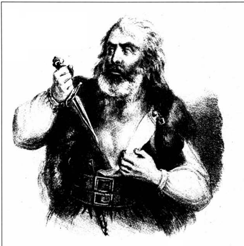
Ampsicora in una ricostruzione ideale

Nel 215 a.C., i sardo punici si sollevarono in armi contro i romani per cacciarli dall'isola. Li guidava Ampsicora, un africano nato in Numidia e trapiantato nella nostra terra, che organizzò la rivolta e si tolse la vita per la morte in battaglia del figlio Osto. Da allora, il suo nome è diventato un simbolo