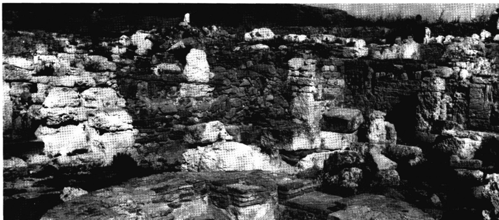
Panoramica degli scavi di Cornus, la città lungo la costa occidentale sarda dove covò la rivolta contro i romani

protosardo. Le navi che trasportavano l'esercito inviato in soccorso da Cartagine, agli ordini di Asdrubale il Calvo, erano state sbattute dal mare verso le Baleari e furono a lungo bloccate nei cantieri dell'isola di Minorca.