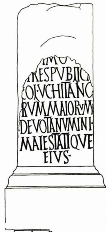
Dedica ad un Cesare anonimo.

I lavori si svolgono di concerto con le ricerche di carattere epigrafico, condotte da un'équipe mista che per la parte italiana fa anch'essa capo al Dipartimento di Storia dell'Università di Sassari ed è diretta dal prof. A. Mastino. Esse hanno come obiettivo l'edizione scientifica delle iscrizioni e la loro catalogazione mediante il sistema informatizzato PETRAE elaborato dall'Università di Bordeaux III.