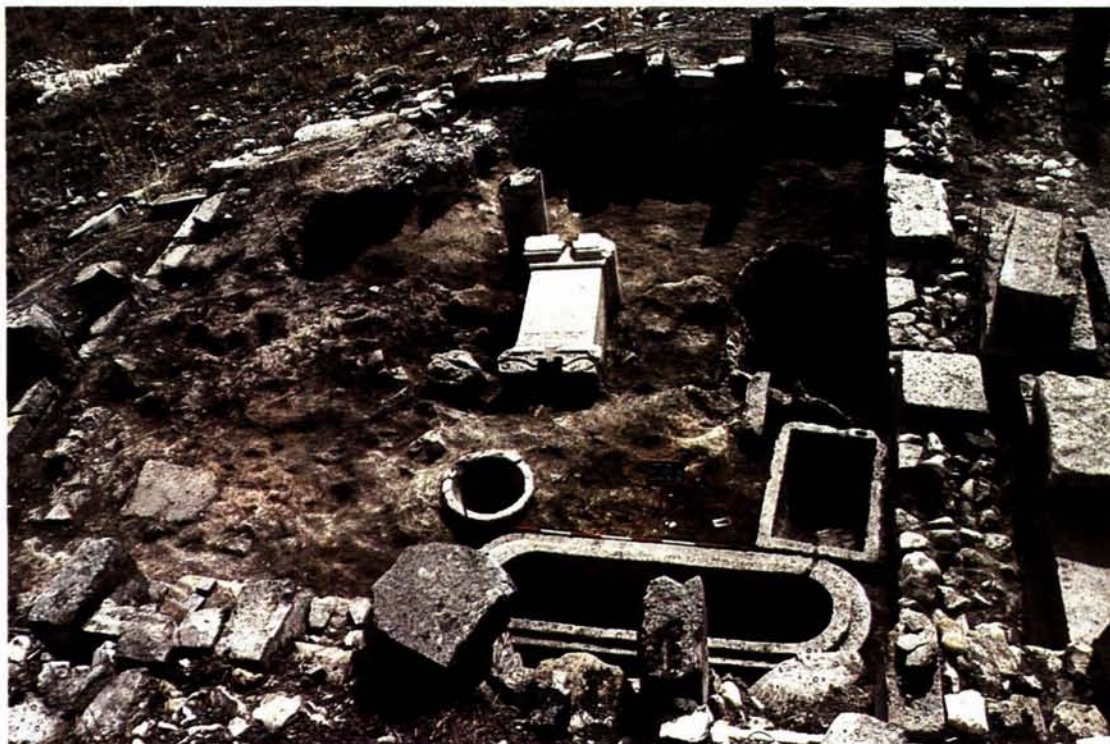
Uchi Maius : il frantoio impiantato nel Foro, con la base dedicata a Faustina.