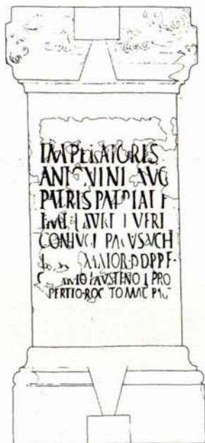
La base di Faustina Augusta in un disegno di Salvatore Ganga.

Oltre a quanto esposto sopra, per ciò che concerne la metodologia da applicare alla ricognizione dei resti conservati nell'area corrispondente al territorio della città romana, questa sarà condotta tenendo conto dei più recenti sviluppi di metodo elaborati nel campo della redazione delle carte archeologiche.