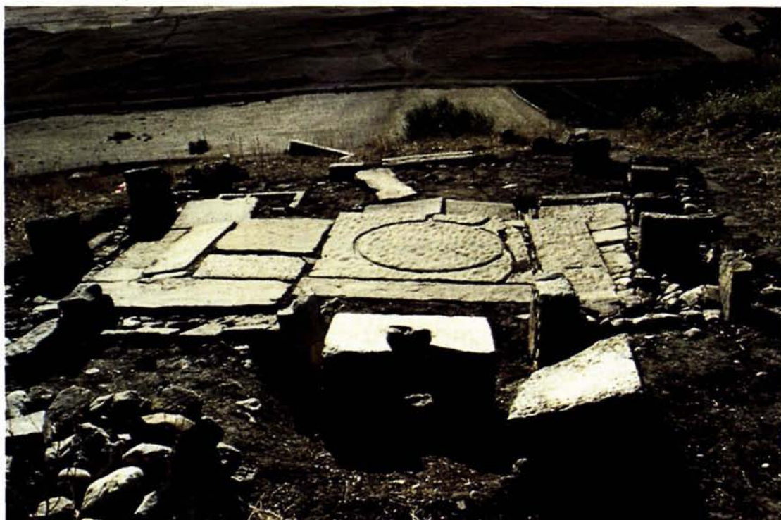
Uchi Maius: un frantoio nella parte meridionale della città.

numerose iscrizioni (CIL VIII, 15446-14467; 26239-26396) recuperate nell'area urbana, che si sono svolte alla fine del secolo scorso e agli inizi di questo, e che sono riprese negli ultimi anni.