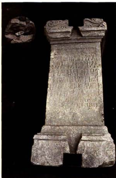
Uchi Maius: dedica a Lucilla reimpiegata nel frantoio del Foro.