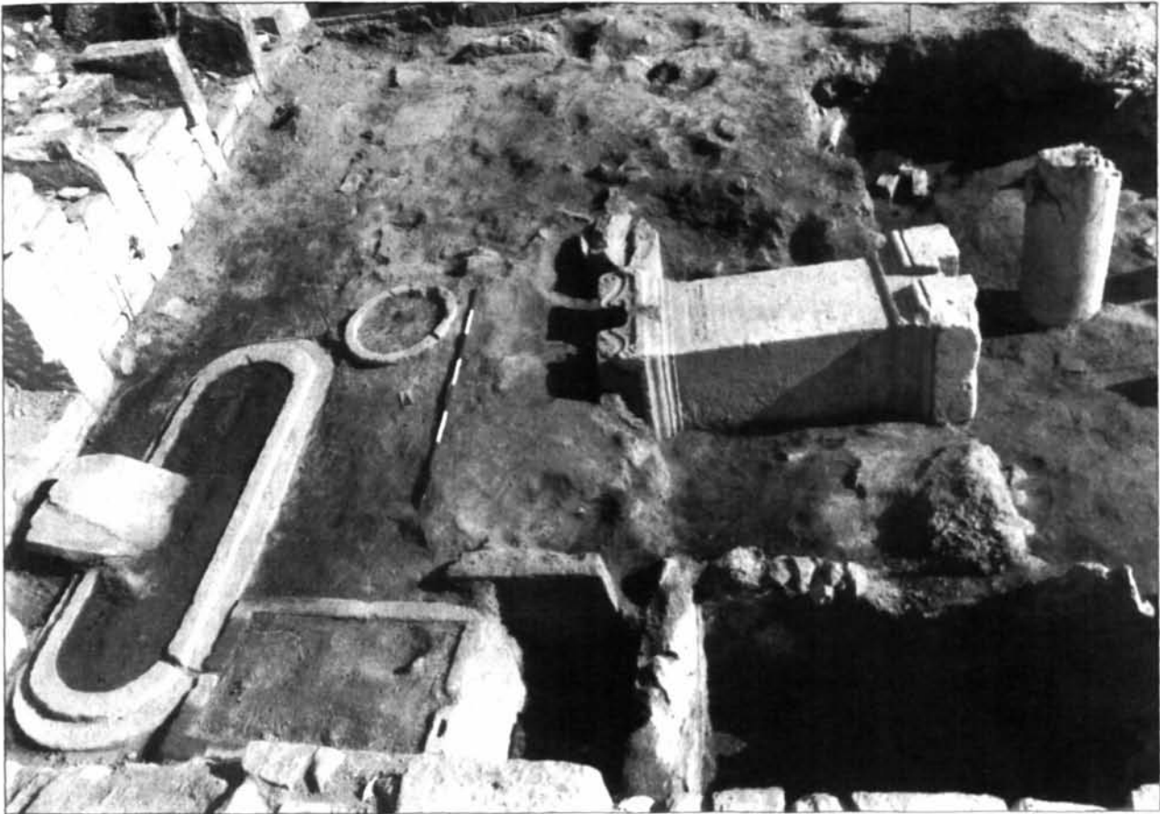
Fig. 2 - Le vasche per la decantazione dell'olio e la base di Lucilla reimpiegata come contrappeso di una pressa.

versata da significativi fenomeni di mobilità sociale, che condurranno alcune famiglie alla condizione equestre 5 e addirittura all'ordine senatorio 6 .