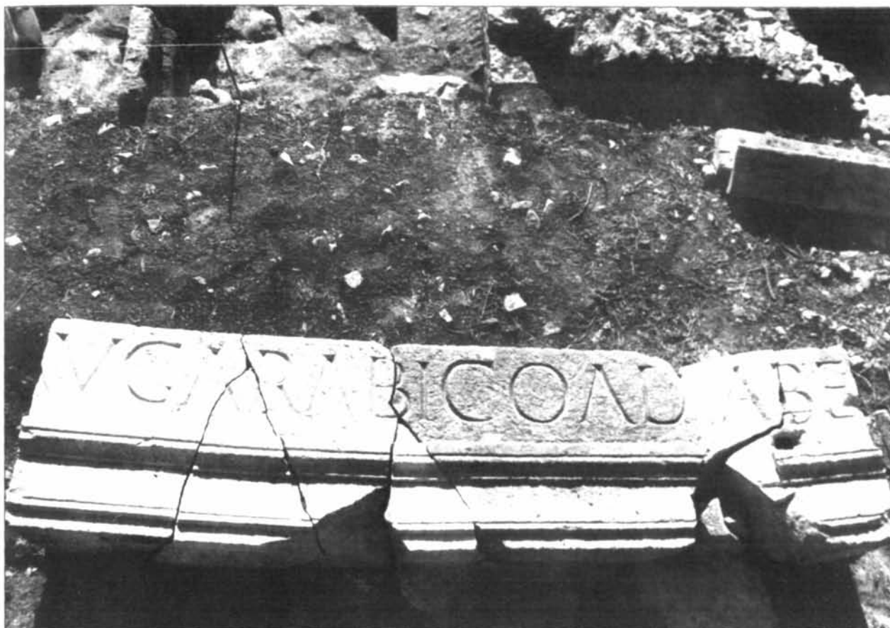
Fig. 3 - Ricostituzione di un blocco dell'epistilio, con alcuni frammenti inediti dell'iscrizione monumentale del foro datata in età severiana al 207 d.C. (CIL VIII 26258).

Va innanzi tutto precisato che le ultime campagne di scavo hanno introdotto rilevanti novità sull'esatta topografia del foro, di cui tre anni fa avevo proposto ipoteticamente una ricostruzione che oggi appare sostanzialmente superata 27 . I dati di base vengono però confermati, come dimostra il ritrovamento di una serie di nuovi frammenti dell'epigrafe che correva sul fregio porticato del foro costruito in età severiana: è certo che l'iscrizione era incisa su conci di cm 235 (8 piedi), se oltre al già noto frammento s per il quale era esplicitamente precisato da Merlin e Poinssot «complet partout» 28 , si può aggiungere ora un secondo blocco spezzato in più frammenti (compresi i vecchi f e g , già noti fin dal secolo scorso), ritrovati nel colluvio del crollo a ri-