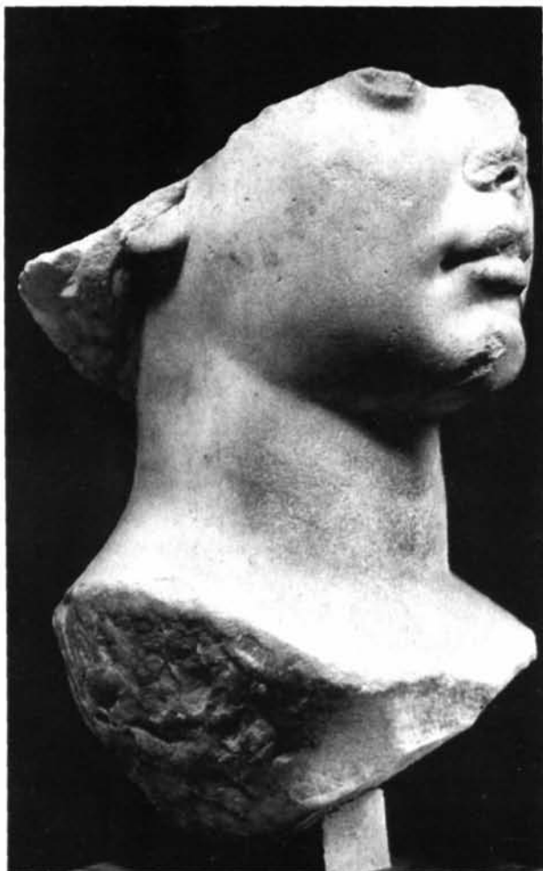
Fig. 6: Sabratha, Museo Archeologico. Ritratto di Lucilla Augusta.

co Aurelio e di Faustina, Annia Aurelia Galeria Lucilla era nata il 7 marzo 148 36 ; al momento del fidanzamento, nel 161, aveva dunque appena 13 anni (rispetto ai 31 di Lucio Vero) 37 . Escluderei che la nostra dedica sia stata effettuata già nel 161, in occasione del fidanzamento di Lucilla, dal momento che l'Augusta compare espressamente come Imperatoris L(uci) Aurel(i) Veri coniux ; eppure l'uso di effettuare dediche alle principesse imperia-