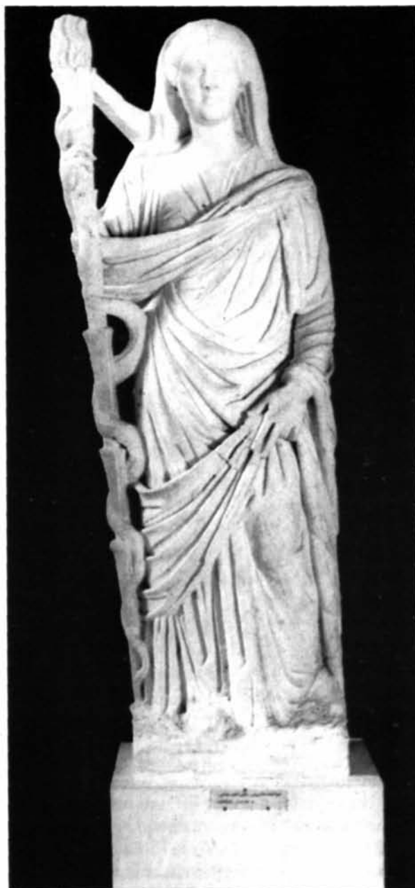
Fig. 5: Museo del Bardo, Tunisi. Lucilla Augusta. Ritratto da Bulla Regia.

Abbiamo detto che l'occasione per la dedica a Lucilla potrebbe esser rappresentata invece dal matrimonio con Lucio Vero, avvenuto ad Efeso nel 164 dopo tre anni di fidanzamento 35 , forse il 7 marzo in occasione del dies natalis che coincideva con il dies imperii di Marco Aurelio; oppure più probabilmente alla fine dell'estate. Figlia secondogenita di Mar-