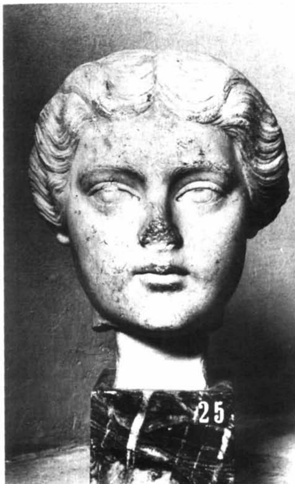
Fig. 8: Roma, Museo dei Conservatori (Braccio Nuovo). Ritratto di Lucilla Augusta.

religio aveva voluto come «garanzia saldissima di fedeltà» (δεσμὸν εὐνοίας ἐχυρώτατον) 41 . Da quest'unione nacque almeno una figlia, che immaginiamo già sposata al momento della morte della madre 42 : alla nascita di questa bambina potrebbe alludere la dedica a Iuno Lucina , effettuata a Roma su un'ara dedicata alla fine del mese di agosto del 166 ( X Kalendas Septembres ). [ Q (uinto) Ser (vilio) Pud (ente), L (ucio) Fuf (idio) Poll (ione) co (n)s (ulibus))