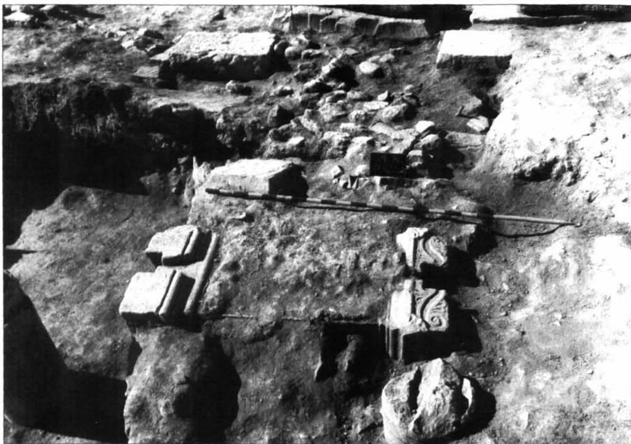
Fig. 1 - Seconda campagna di scavo ad Uchi Maius. Edificio prospiciente a nord-est la piazza forense: rimozione della calcara tarda. La scoperta della base di statua in calcare di Lucilla. US 2241, area 2200 (9 settembre 1996).

rapporto di parentela con Lucilla: non escluderei possa trattarsi di un indizio di una particolare devozione degli Uchitani nei confronti di Marco Aurelio, in relazione a benefici imperiali concessi al pagus ; più probabile appare l'ipotesi che si tratti di un elemento cronologico, che porta a sottolineare l'indicazione dell'ascendente paterno, in una circostanza, quella del matrimonio con Lucio Vero, che come si dirà potrebbe costituire la vera occasione della dedica. Da un punto di vista cronologico, poi, appare significativa la mancata menzione dei cognomina ex virtute di Lucio Vero, fatto che dovrebbe obbligarci a collocare comunque il nostro testo in epoca precedente la grande vittoria partica del 166 2 .