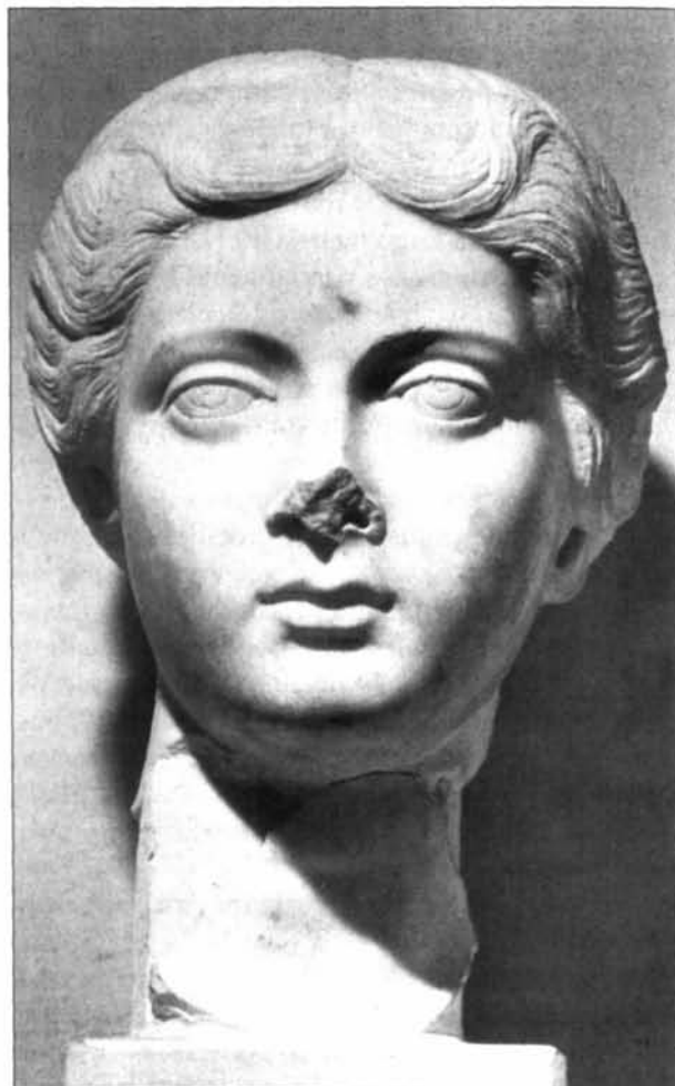
Fig. 7: Tripoli, Castello-Museo Archeologico. Ritratto di Lucilla Augusta.

li in occasione del fidanzamento è documentato a breve distanza di anni nella vicina Thugga, per Plautilla, fidanzata prima del 202 a Caracalla 38 ; proprio a Thugga era in costruzione il Capitolium , dedicato poi tra il 166 ed il 167, dopo la vittoria partica 39 . Il titolo di Augusta sembra strettamente connesso con il matrimonio con il trentaquattrenne Lucio Vero, avvenuto nell'estate 164, quando Lucilla aveva appena 16 anni 40 , matrimonio che Marco Au-